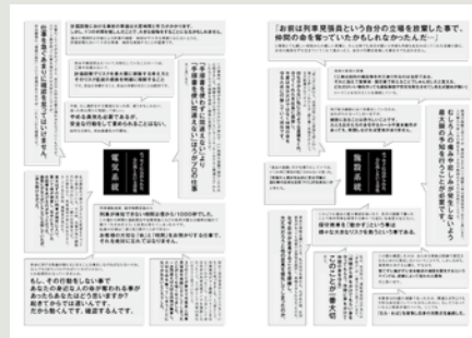
【運転事故・労働災害防止エッセイ集（抜粋）】