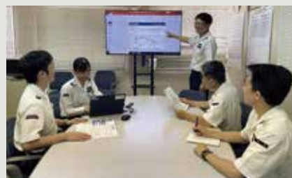
【「One STEP」活動 会合の様子】

「One STEP」活動の活性化およびレベルアップを図るため、集合教育、職場内セミナーを開催する他、活動の成果を共有し、相互啓発の場として職場単位から全社単位の発表会を開催するなど、様々な取組みを行い、社員の能力向上に繋げています。