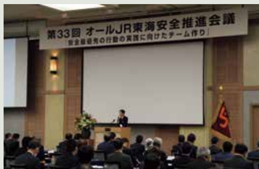
【オールJR東海安全推進会議】