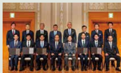
【提案特別賞表彰式】

現業機関において、日常の仕事をしている中で「こうすればもっと質の高い仕事ができる」や「こうすればさらに安全になる」といった工夫やアイデアを業務に反映させる制度で、2023年度は約9割の社員が参加し、一人当たり約12件、全体で約12万件の提案が提出されました。また、特に優れた提案については他職場での活用を推進し、表彰制度も設けています。