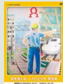
【運転事故防止・労働災害防止ポスター】