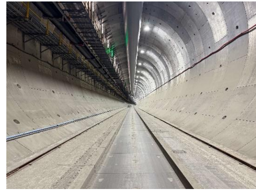
（梶ヶ谷工区：トンネル坑内の様子）

犬蔵非常口到達後、2026年夏～秋頃に犬蔵非常口から東百合丘非常口へのシールド掘進に着手する予定です。東百合丘非常口まで掘進した後に、梶ヶ谷非常口から等々力非常口に向けて掘進を行い、2030年度中に本線シールドの掘進が完了する見込みです。