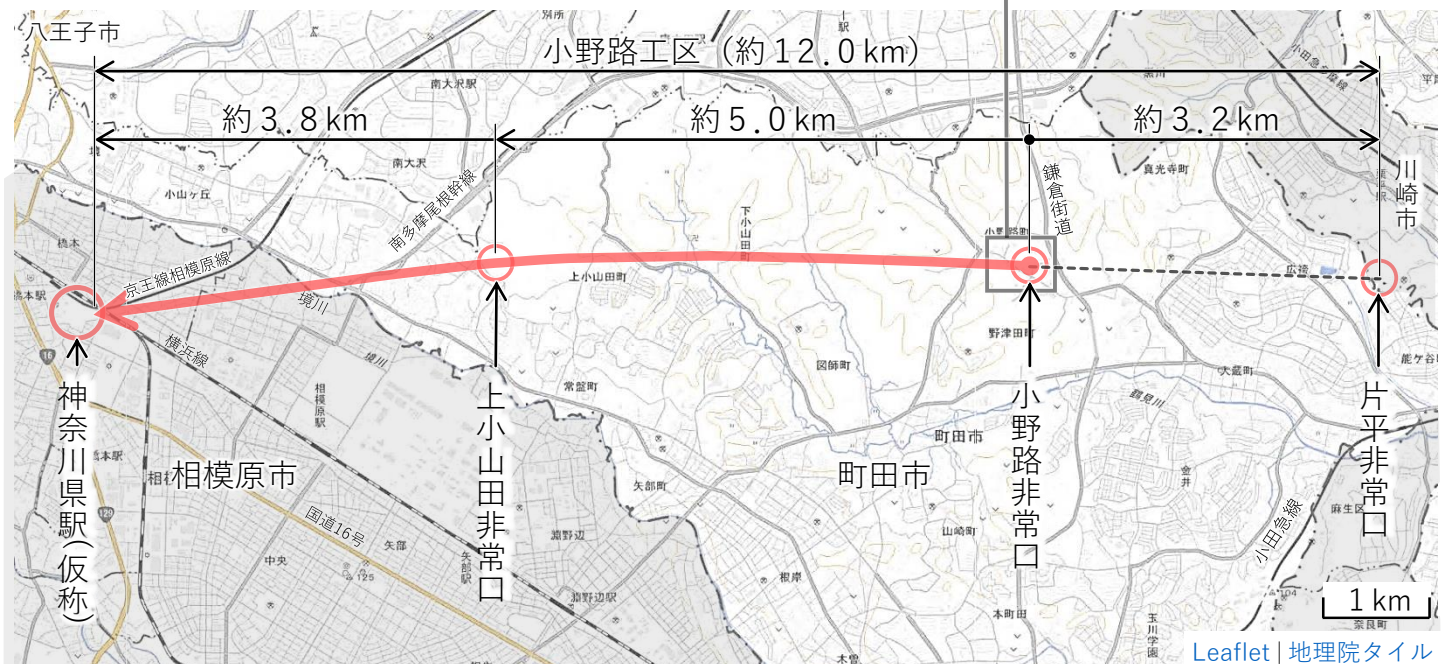
第一首都圏トンネル(小野路工区)の位置図

※ 調査掘進は、シールドマシンの後ろに繋ぐ一連の設備を収める長さまで行います。途中で、段取り替えのため、一時的に掘進を停止する期間があります。