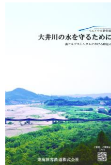
パンフレット表紙

ぜひ、皆さまのご意見・ご質問をお寄せください。いただいたご意見・ご質問を、今後の取組みや地域の皆さまへのご説明に活かしてまいります。