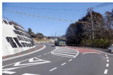
県道北林飯島線拡幅