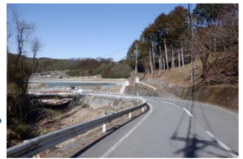
見通し不良区間の立木伐採