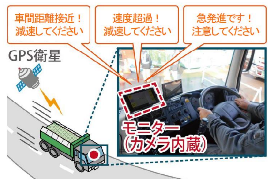
安全運行管理システム（イメージ）