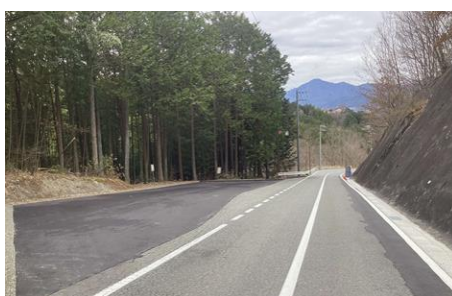
村道壬生沢線拡幅