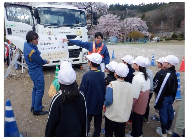
交通安全教室（2025年4月中川村）