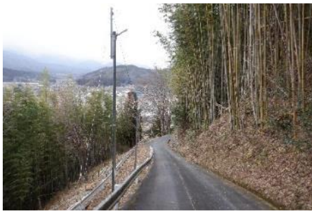
歩行者迂回路の環境整備 (防犯灯増設、立木伐採)