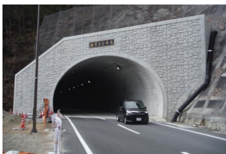
主要地方道松川インター大鹿線 西下トンネル新設