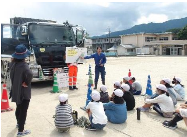
交通安全教室（2024年6月松川町）

飯田ケーブルテレビの当社提供番組「教えて！リニアのリアル～地域の日常を守れ！発生土運搬の安全対策～」にて、安全対策を紹介しました。（当社YouTubeチャンネル（ https://youtu.be/WUrIFJD31oI ）にてご覧いただけます）