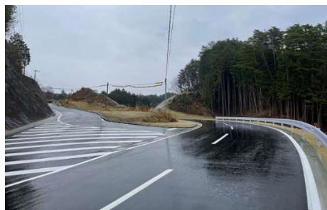
村道佐原線新設・拡幅