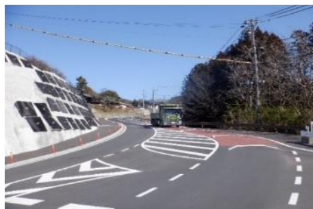
県道北林飯島線拡幅