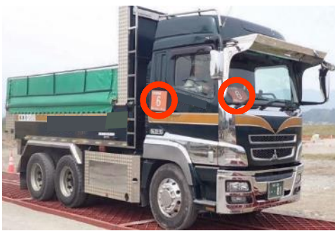
工事用車両の明示

発生土運搬用のダンプトラック等には、GPSを用いた安全運行管理システムを導入しており、速度を超過したり、指定経路以外を走行したりすることを防止するとともに、音声案内により要注意箇所を警告し、運転者の安全意識を向上させるといった取組みも行っています。