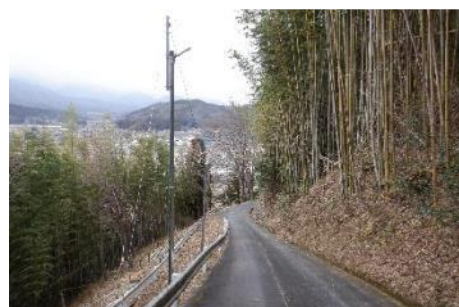
歩行者迂回路の環境整備 (防犯灯増設、立木伐採)