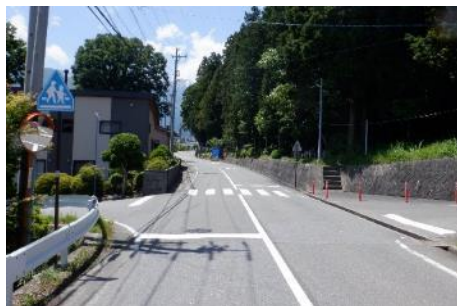
区画線の引直し、 カーブミラー盤交換