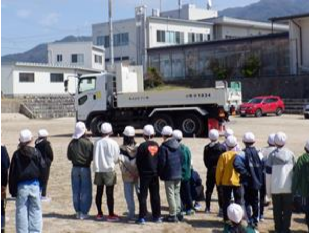
交通安全教室（2024年4月中川村）

飯田ケーブルテレビの当社提供番組「教えて！リニアのリアル～地域の日常を守れ！発生土運搬の安全対策～」にて、安全対策を紹介しました。（当社YouTubeチャンネル（ https://youtu.be/WUrIFJD31oI ）にてご覧いただけます）