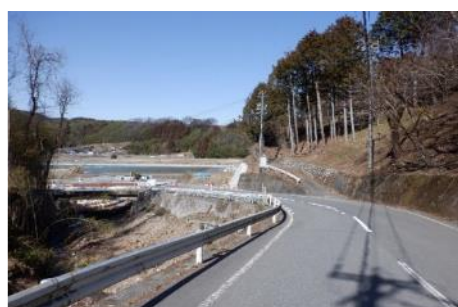
見通し不良区間の立木伐採