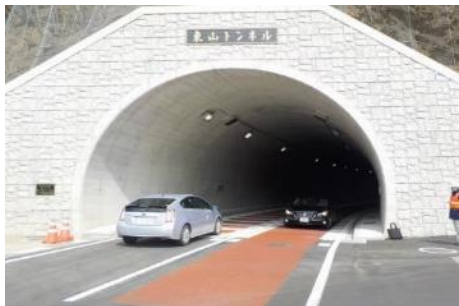
主要地方道松川インター大鹿線 東山トンネル新設

地域の皆様のご要望等を踏まえ、工事用車両が通行する道路の新設・拡幅や路盤の改良、トンネルの新設等を行っています。これらは工事終了後も地域の皆様にご活用いただくことを想定して整備しています。