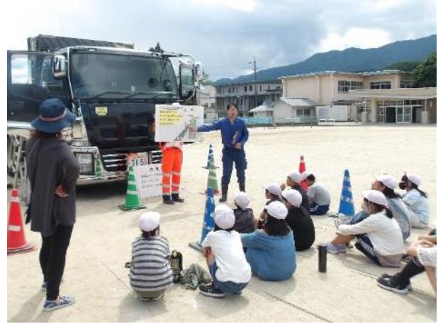
交通安全教室（2024年6月松川町）