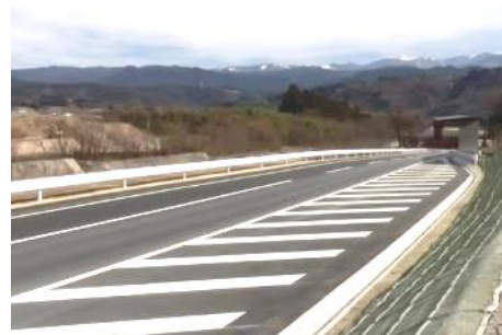
町道洞新線新設・拡幅