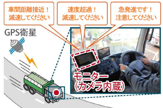
安全運行管理システム（イメージ）