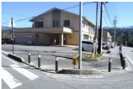
車止めポストの設置

また、歩行者の方の安全確保のために、通学時間帯などの特定の時間帯の通行を避けることや、交通誘導員の配置、安全設備の設置、安全な歩行ルートの確保などの対策についても、地域の皆様のご意見を踏まえ必要に応じて取り組んでいます。