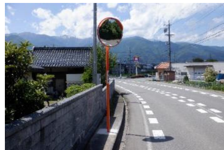
カーブミラー新設