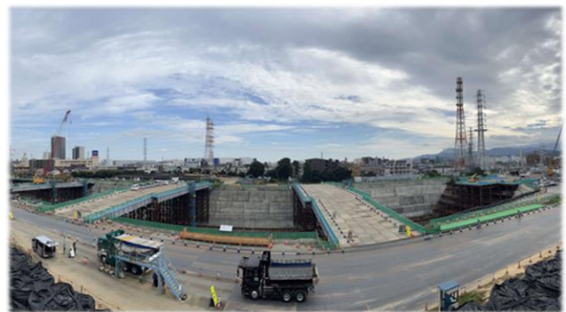
〈リニアひろばからの景色〉

※団体（10人以上）でご利用される場合は、下記の連絡先に来園される前日までにご連絡をお願いします。