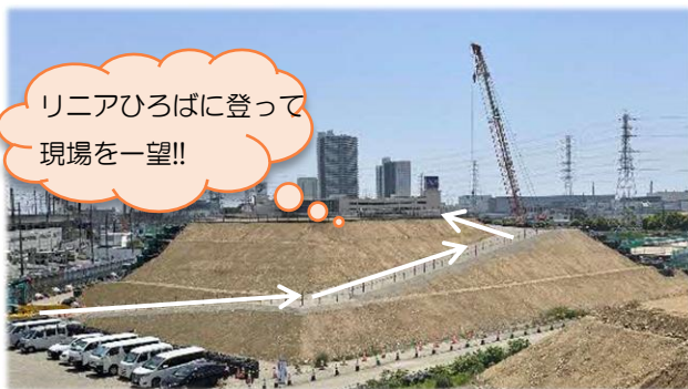
〈リニアひろばの様子〉