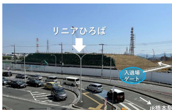
入退場ゲートの位置 (JR 橋本駅構内より撮影)

◆リニアひろばに関するご不明点等については、以下の「お問い合わせ先」にご連絡ください。