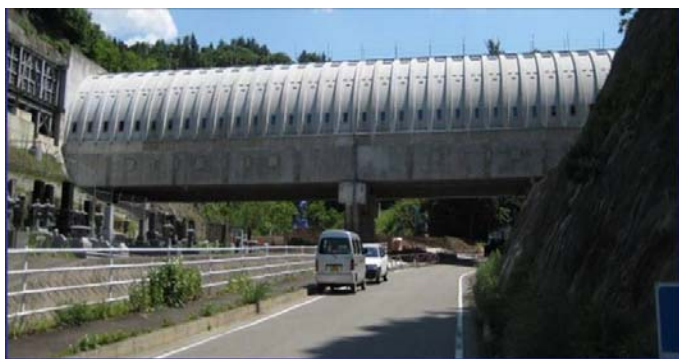
明かりフード（山梨リニア実験線）

※新幹線騒音に係る環境基準について（抜粋） （昭和50年7月29日、環境庁告示46号）