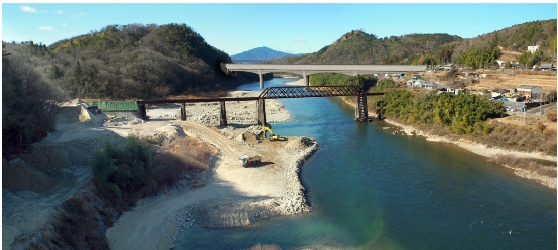
图 13-1-2-14 第 2 木曾川橋梁