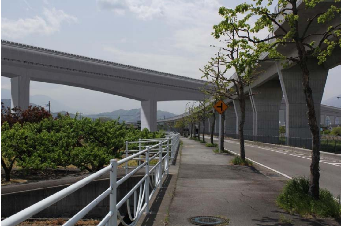
圖 13-1-2-10 中部橫斷自動車道架道橋