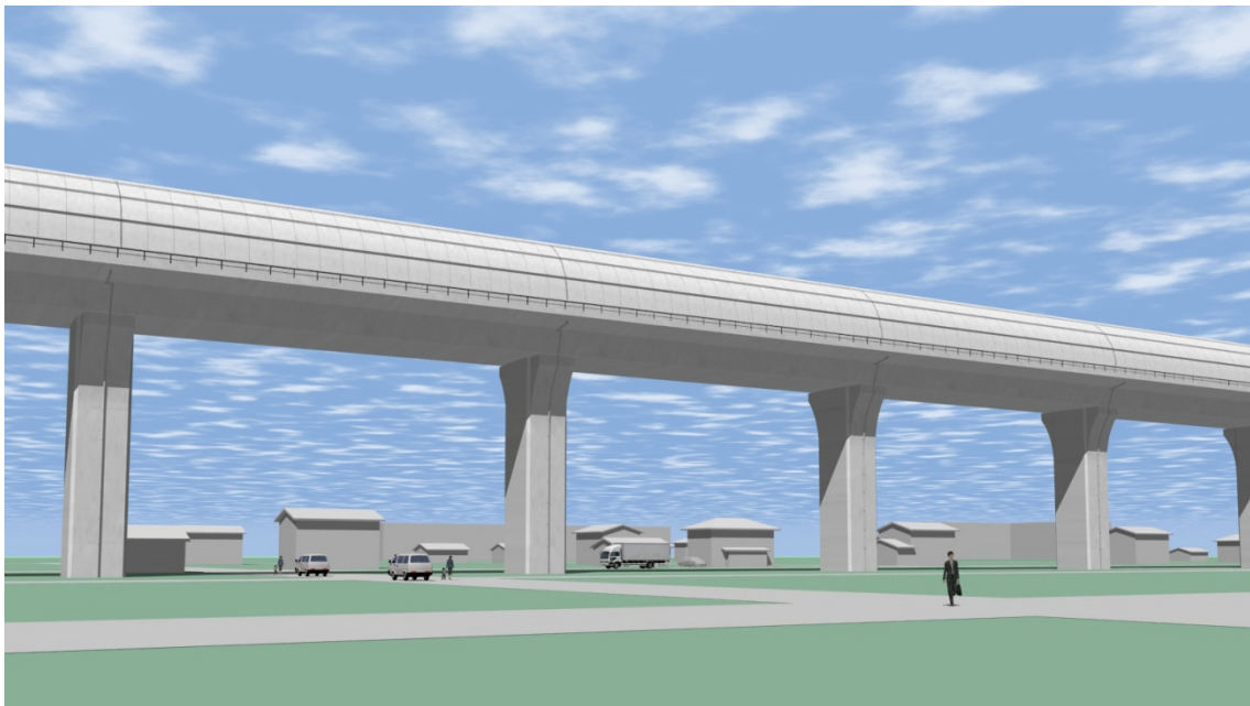
図 13-1-2-1 桁式高架橋