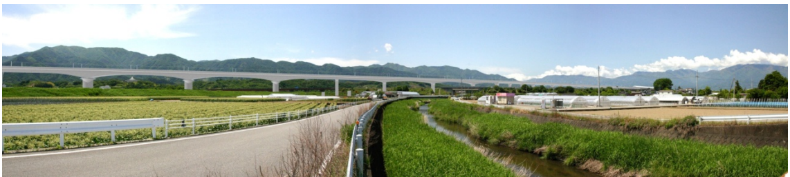
图 13-1-2-7 笛吹川・濁川橋梁及び第2中央自動車道架道橋