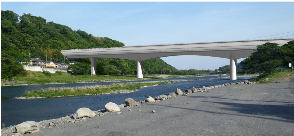
図 13-1-2-5 相模川橋梁

景観上の重要な箇所であり、景観の創出の観点から長大橋梁を視対象とした視点場を必要に応じて設定するとともに、複雑な印象を与える異種構造物とのデザインの統合を図る観点に加えて「長大橋梁の側径間部も含めた径間のバランス」、「橋脚と桁のバランス」、及び「全体的な重量感の軽減」に配慮した。検討を行った橋梁についてのフォトモンタージュを図 13-1-2-5～図 13-1-2-15 に示す。なお、概略条件下で基本事項を踏まえて検討したものであるため、最終的な形式及び形状等は今後の詳細検討や設計を経て確定していく。