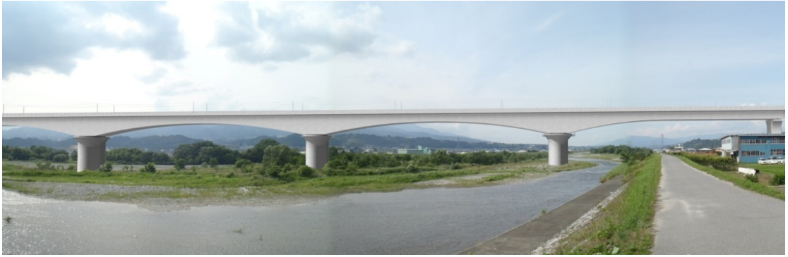
图 13-1-2-12 天竜川橋梁