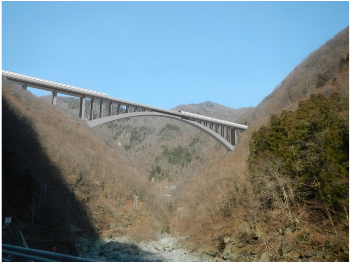
圖 13-1-2-11 早川橋梁