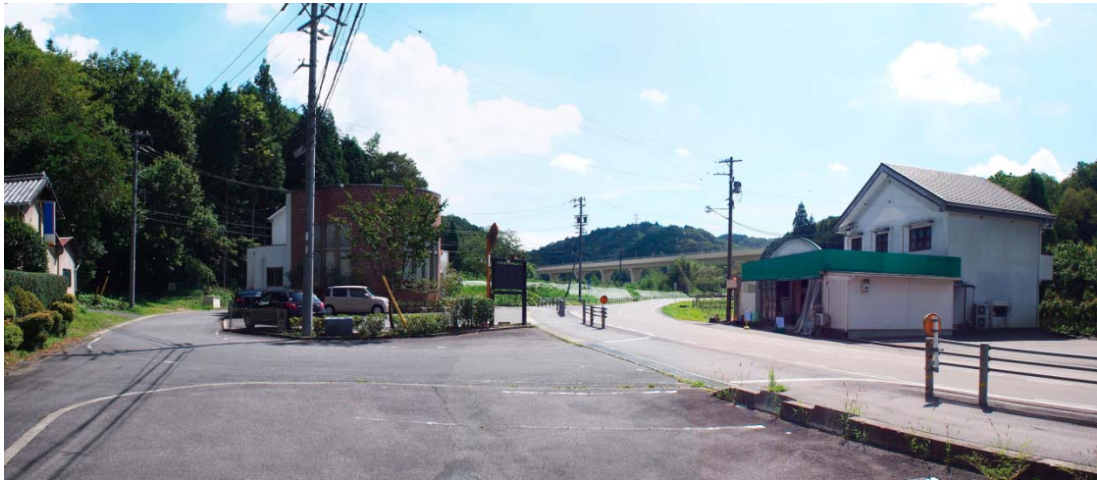
図 13-1-2-15 久々利高架橋