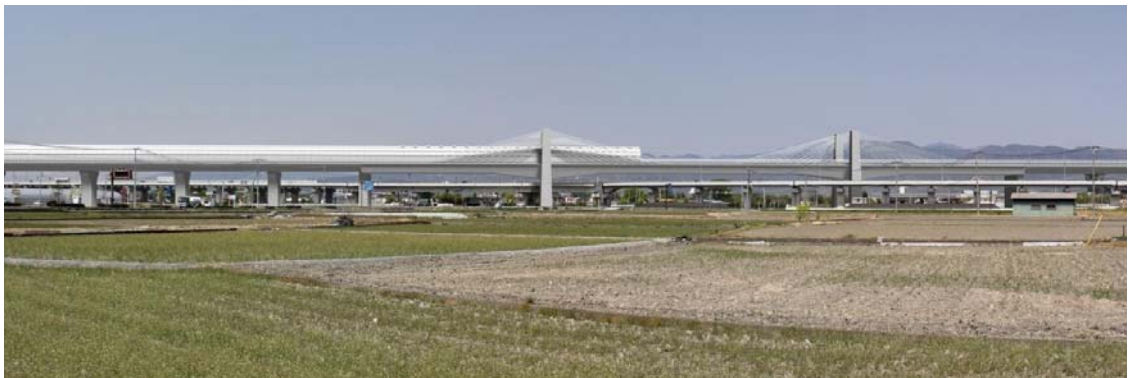
图 13-1-2-8 新山梨環状道路架道橋