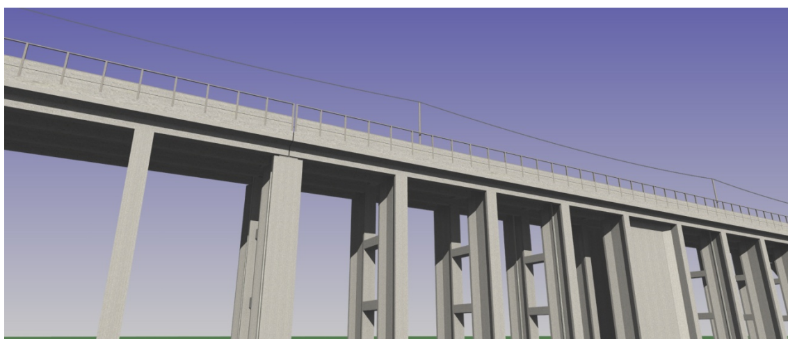
図 13-1-2-3 新形式高架橋（防音壁部）