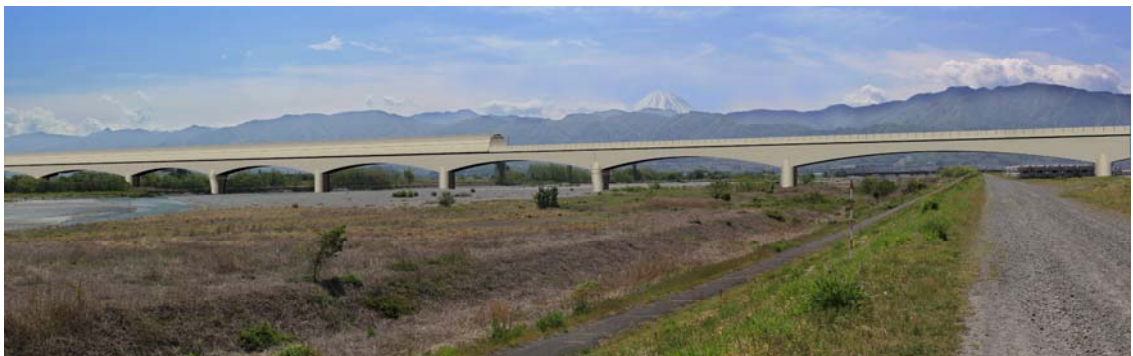
图 13-1-2-9 釜無川橋梁