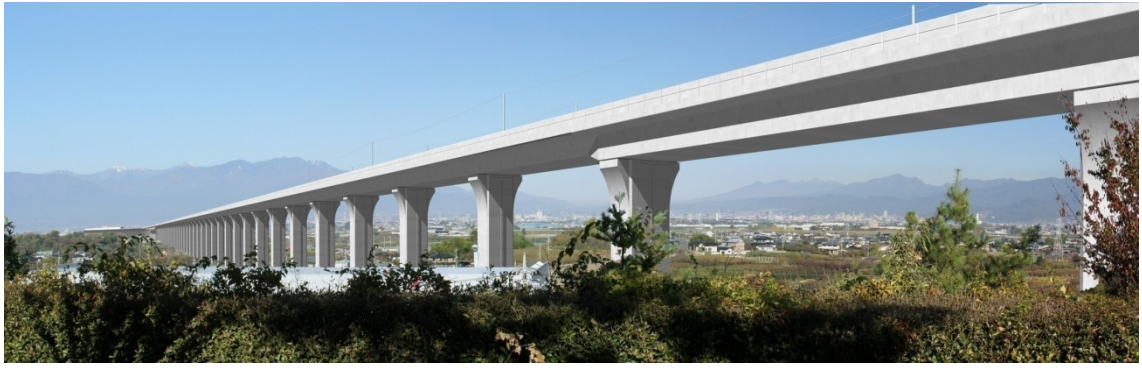
图 13-1-2-6 第1中央自動車道架道橋