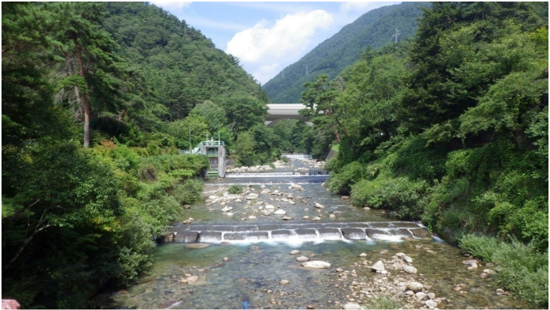
图 13-1-2-13 松川橋梁