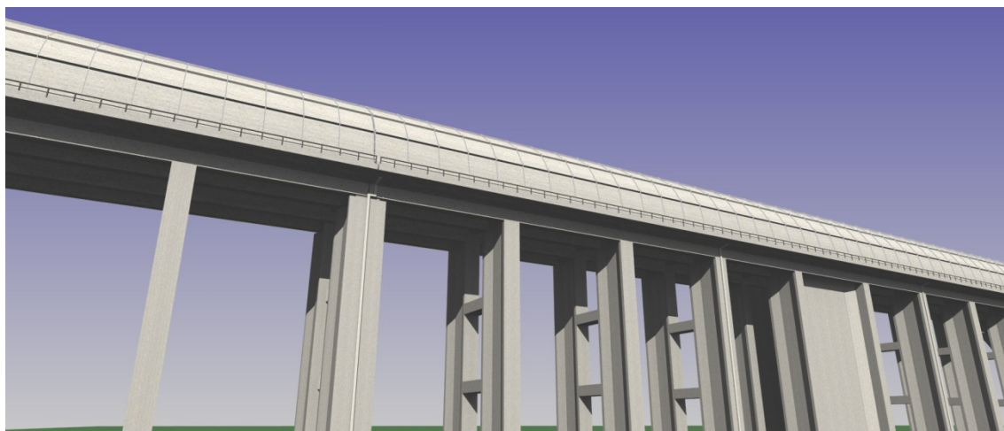
図 13-1-2-2 新形式高架橋（防音防災フード部）

桁式高架橋と同様の検討に加え、煩雑性の軽減の観点から、橋脚の幅を厚くして線路方向の中間梁を無くすとともに、防音壁部においては排水管について主な視点から見えない側の窪みに配置することとした。また、形状に新規性があり斬新なイメージの創出に繋がるとともに、桁厚と橋脚幅が小さく圧迫感が小さいことから、住居地域も含め積極的に適用していくこととした。新形式高架橋のイメージを図 13-1-2-2～図 13-1-2-3 に示す。また、桁式高架橋との境界部においては、両側からの構造の連続性に配慮しつつ自然な形で構造の変化点を表現する形状とした。桁式高架橋と新形式高架橋の境界部のイメージを図 13-1-2-4 に示す。