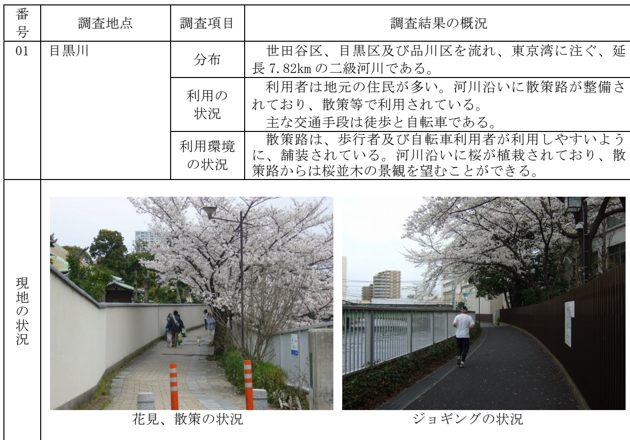
表 8-5-2-2(1) 主要な人と自然との触れ合いの活動の場の分布、利用の状況及び利用環境の状況