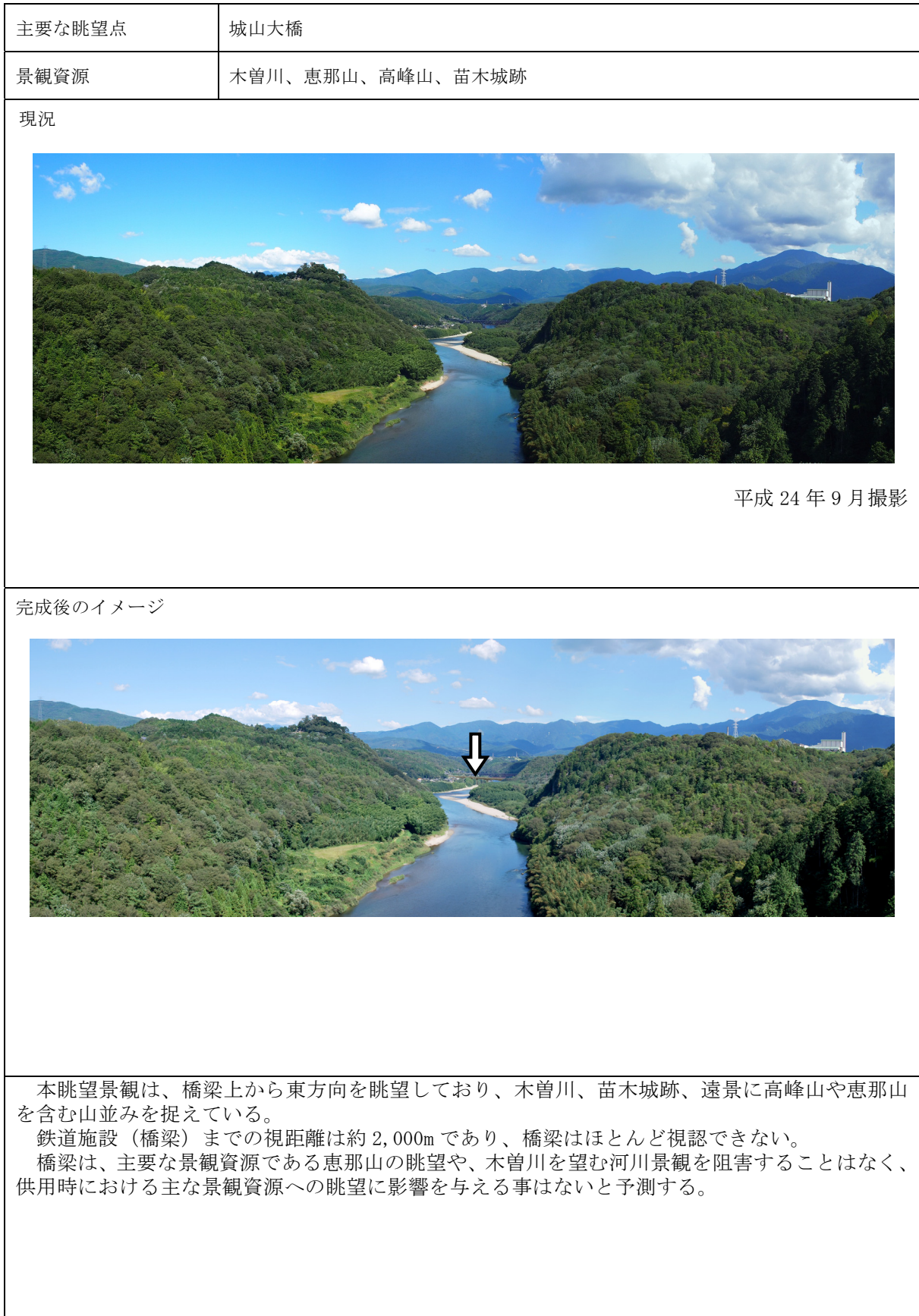
図 8-5-1-1 (3) 主要な眺望景観の変化の予測結果