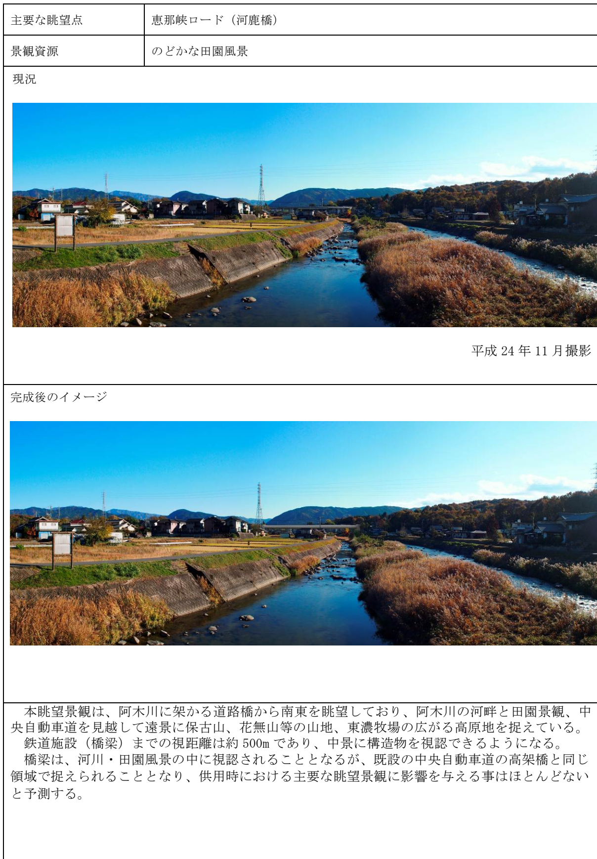
図 8-5-1-1(8) 主要な眺望景観の変化の予測結果