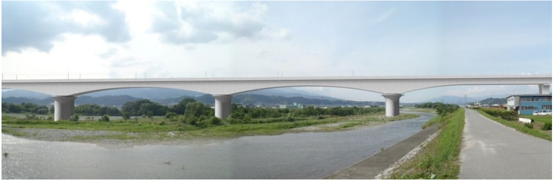
图 13-1-2-12 天竜川桥梁