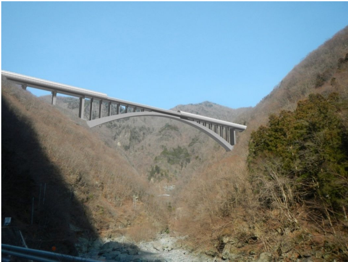
图 13-1-2-11 早川桥梁