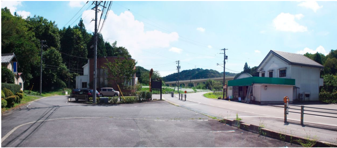
図 13-1-2-15 久々利高架橋