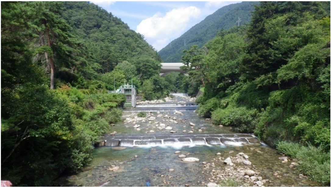
图 13-1-2-13 松川桥梁