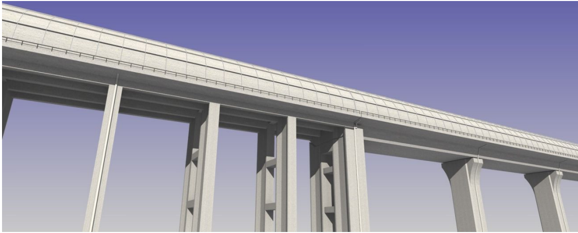
図 13-1-2-4 桁式高架橋と新形式高架橋境界部の処理