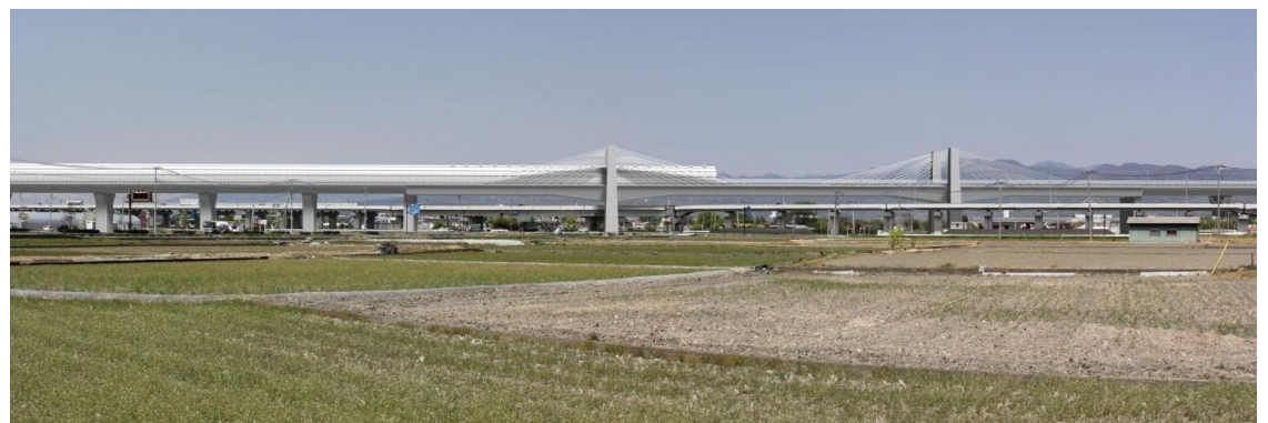
图 13-1-2-8 新山梨環状道路架道橋