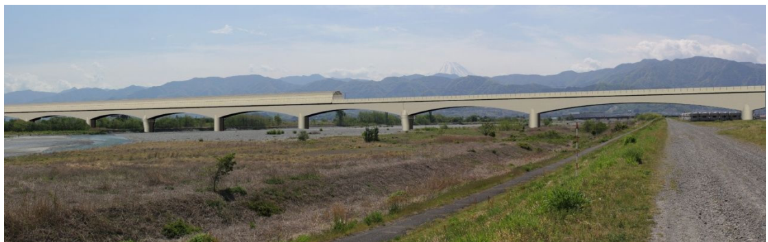
图 13-1-2-9 釜無川橋梁