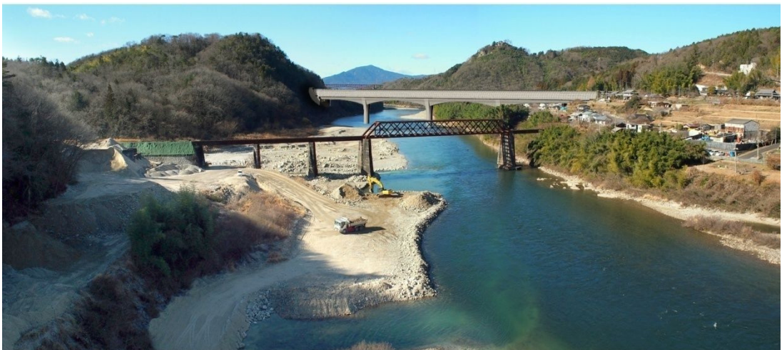
图 13-1-2-14 第2木曾川桥梁