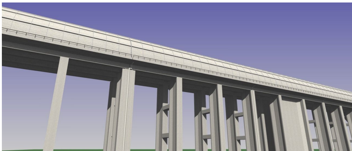
図 13-1-2-2 新形式高架橋（防音防災フード部）

桁式高架橋と同様の検討に加え、煩雑性の軽減の観点から、橋脚の幅を厚くして線路方向の中間梁を無くすとともに、防音壁部においては排水管について主な視点から見えない側の窪みに配置することとした。また、形状に新規性があり斬新なイメージの創出に繋がるとともに、桁厚と橋脚幅が小さく圧迫感が小さいことから、住居地域も含め積極的に適用していくこととした。新形式高架橋のイメージを図 13-1-2-2 及び図 13-1-2-3 に示す。また、桁式高架橋との境界部においては、両側からの構造の連続性に配慮しつつ自然な形で構造の変化点を表現する形状とした。桁式高架橋と新形式高架橋の境界部の概要を図 13-1-2-4 に示す。