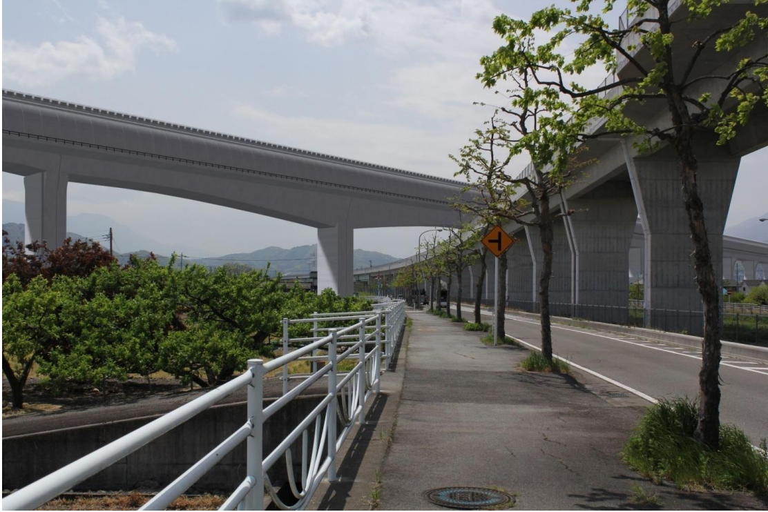
图 13-1-2-10 中部横断道架道橋