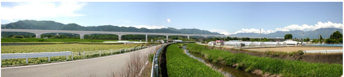
图 13-1-2-7 笛吹川・濁川橋梁及び第2中央自動車道架道橋