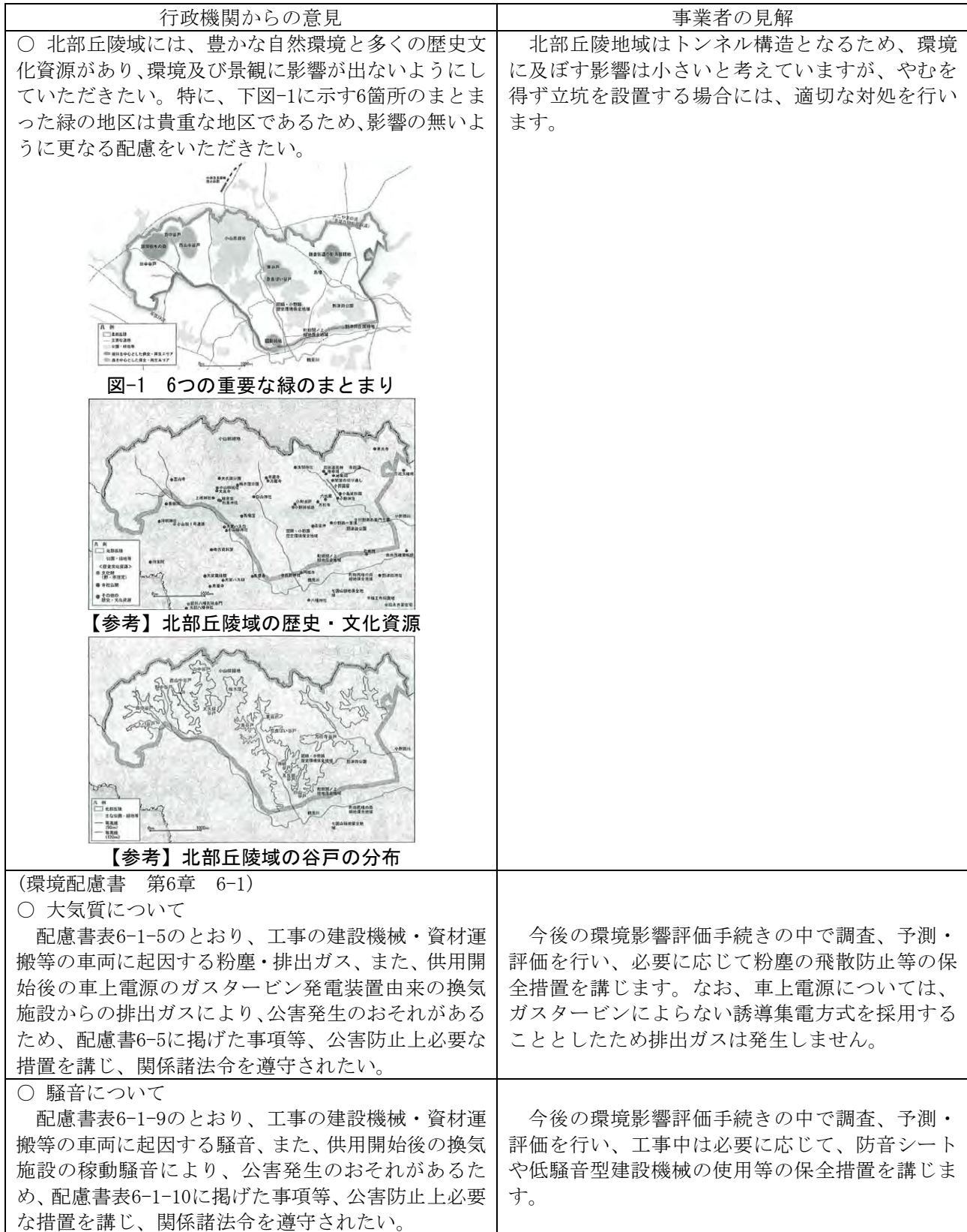
表 5-2-3-2(14) 行政機関からの意見と事業者の見解（地方自治体）