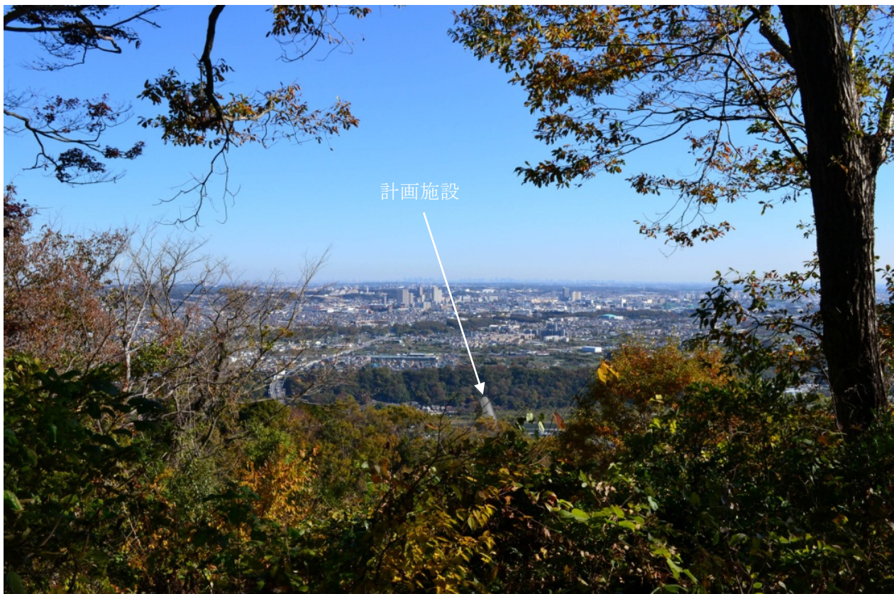
図 8-5-1-1 (7) 主要な眺望景観の変化の予測結果