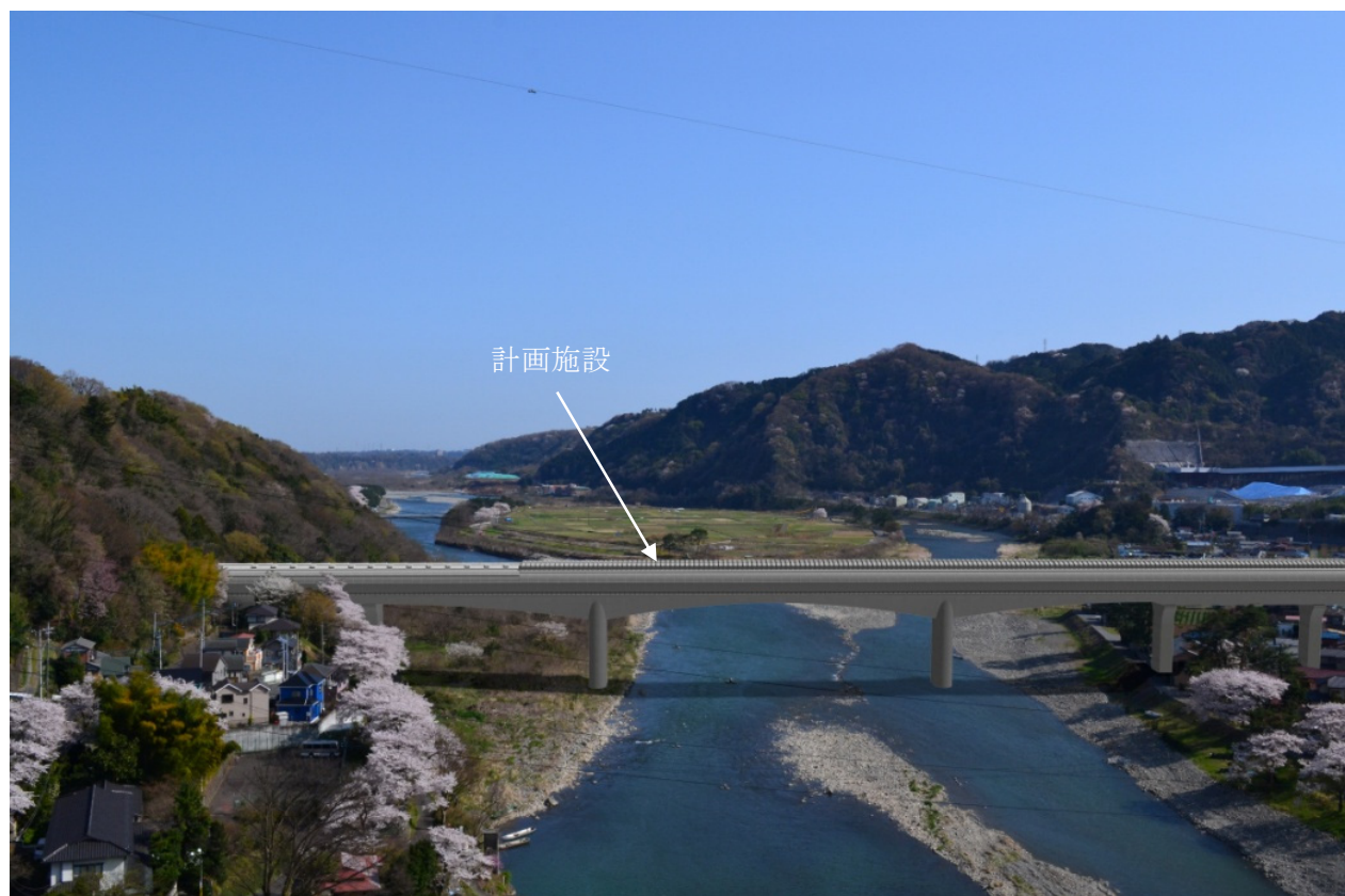
図 8-5-1-1(4) 主要な眺望景観の変化の予測結果