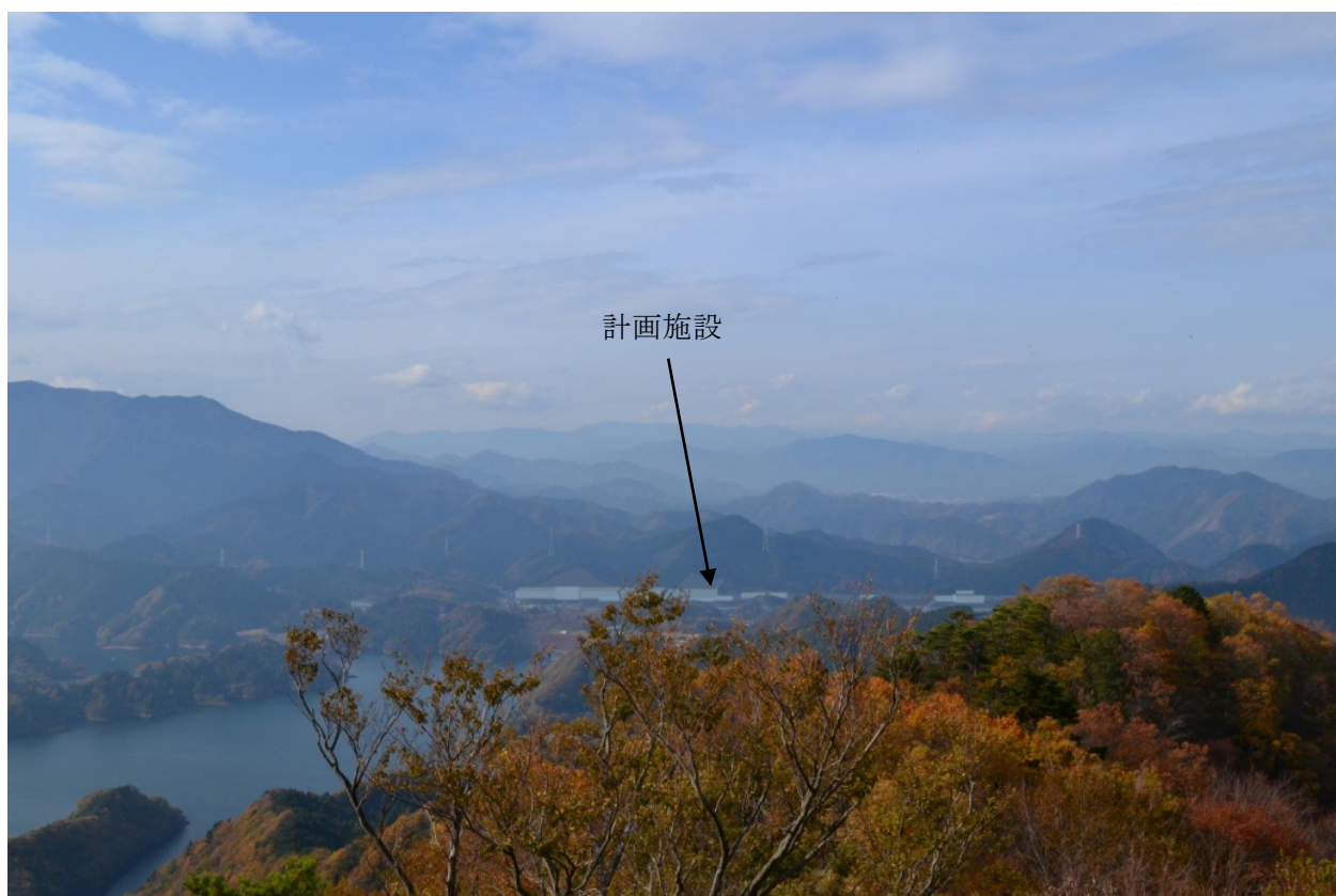
図 8-5-1-1 (8) 主要な眺望景観の変化の予測結果