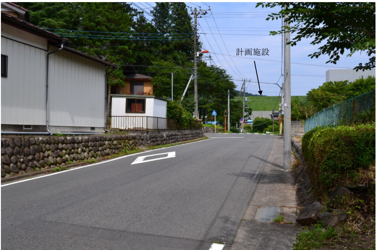
図 8-5-1-2(4) 日常的な視点場からの景観の変化の予測結果