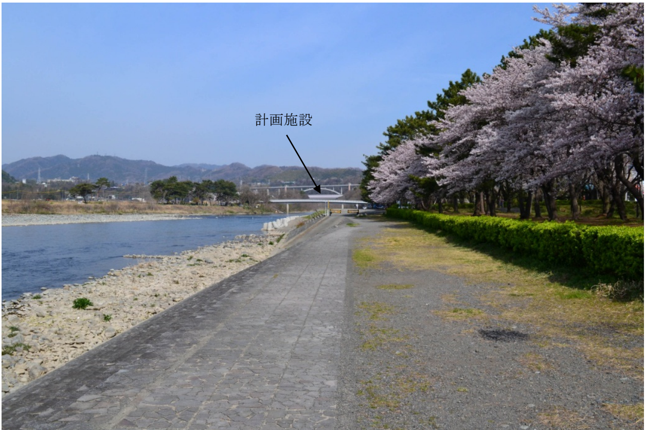
図 8-5-1-1 (2) 主要な眺望景観の変化の予測結果