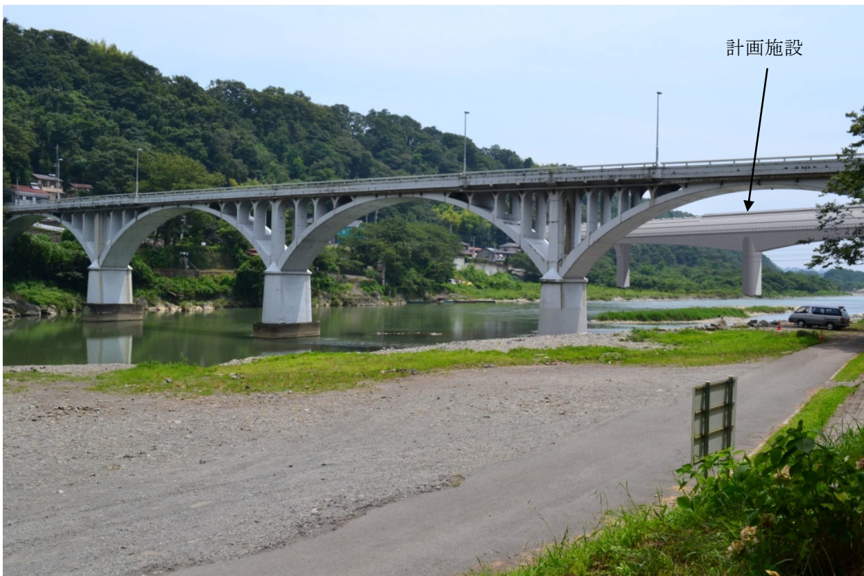
図 8-5-1-1 (6) 主要な眺望景観の変化の予測結果