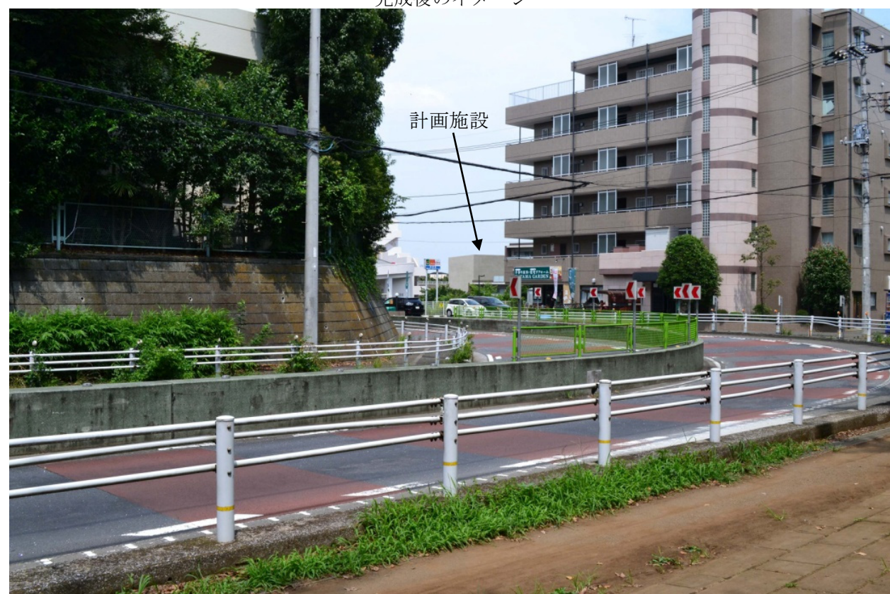
図 8-5-1-2 (2) 日常的な視点場からの景観の変化の予測結果