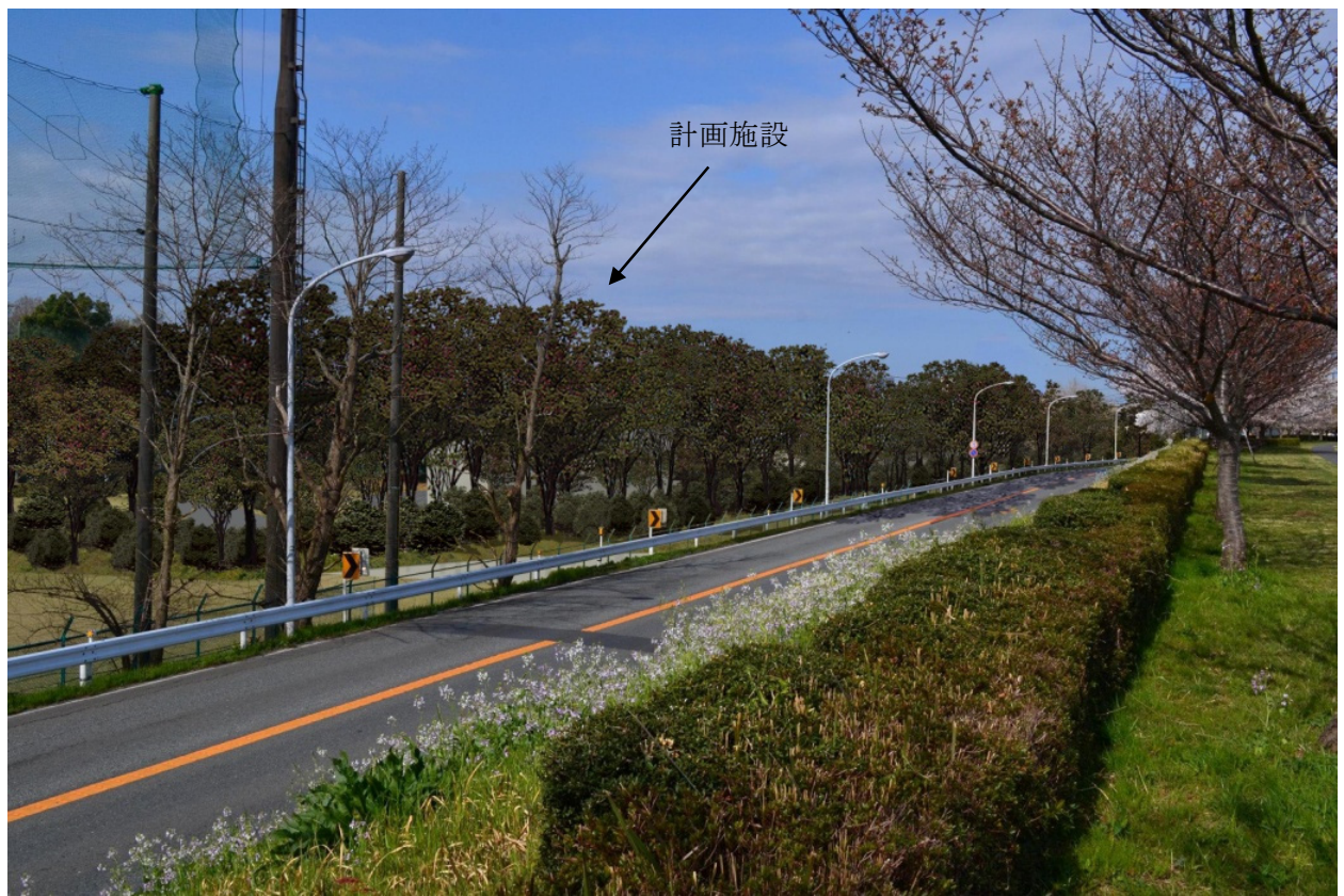
図 8-5-1-1(1) 主要な眺望景観の変化の予測結果