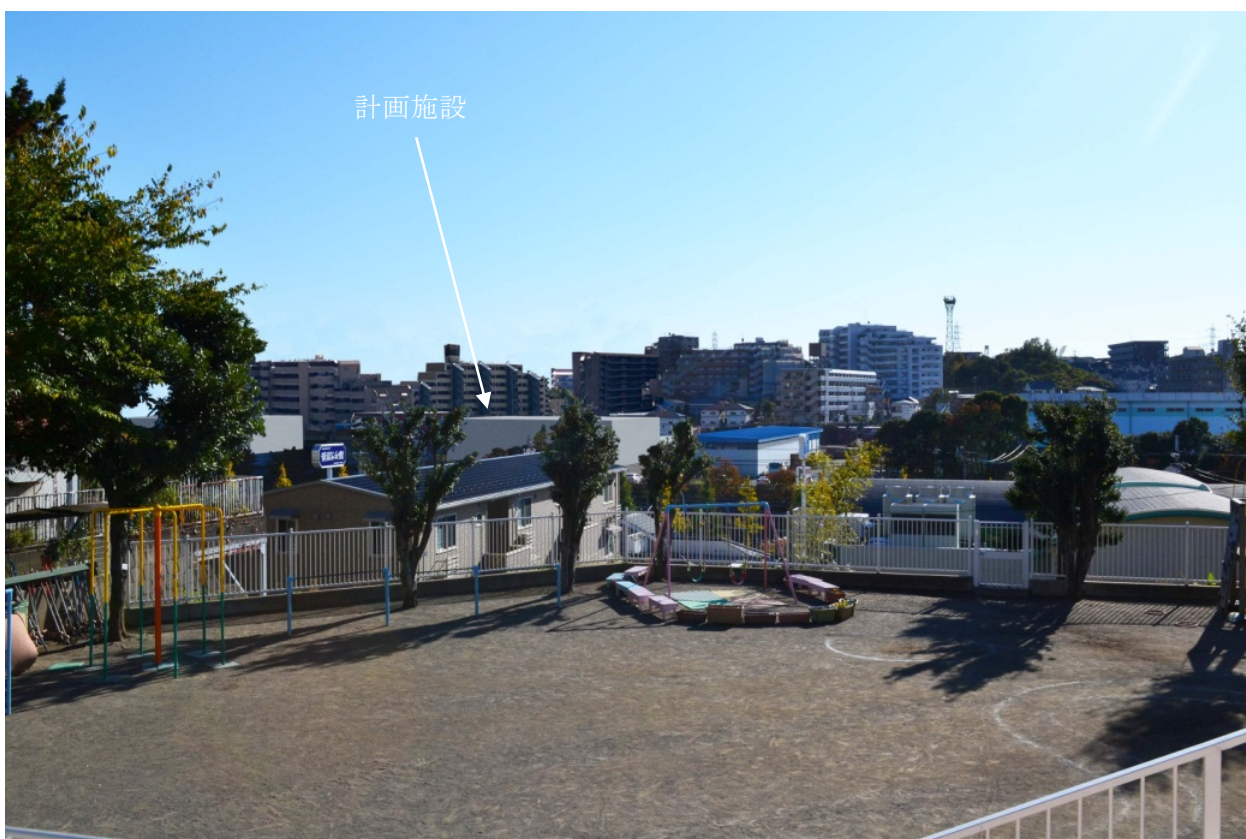
図 8-5-1-2(1) 日常的な視点場からの景観の変化の予測結果