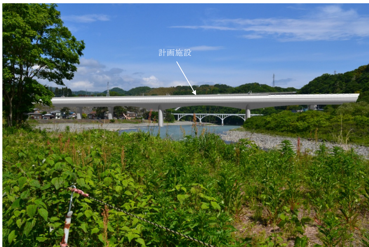
図 8-5-1-1 (3) 主要な眺望景観の変化の予測結果