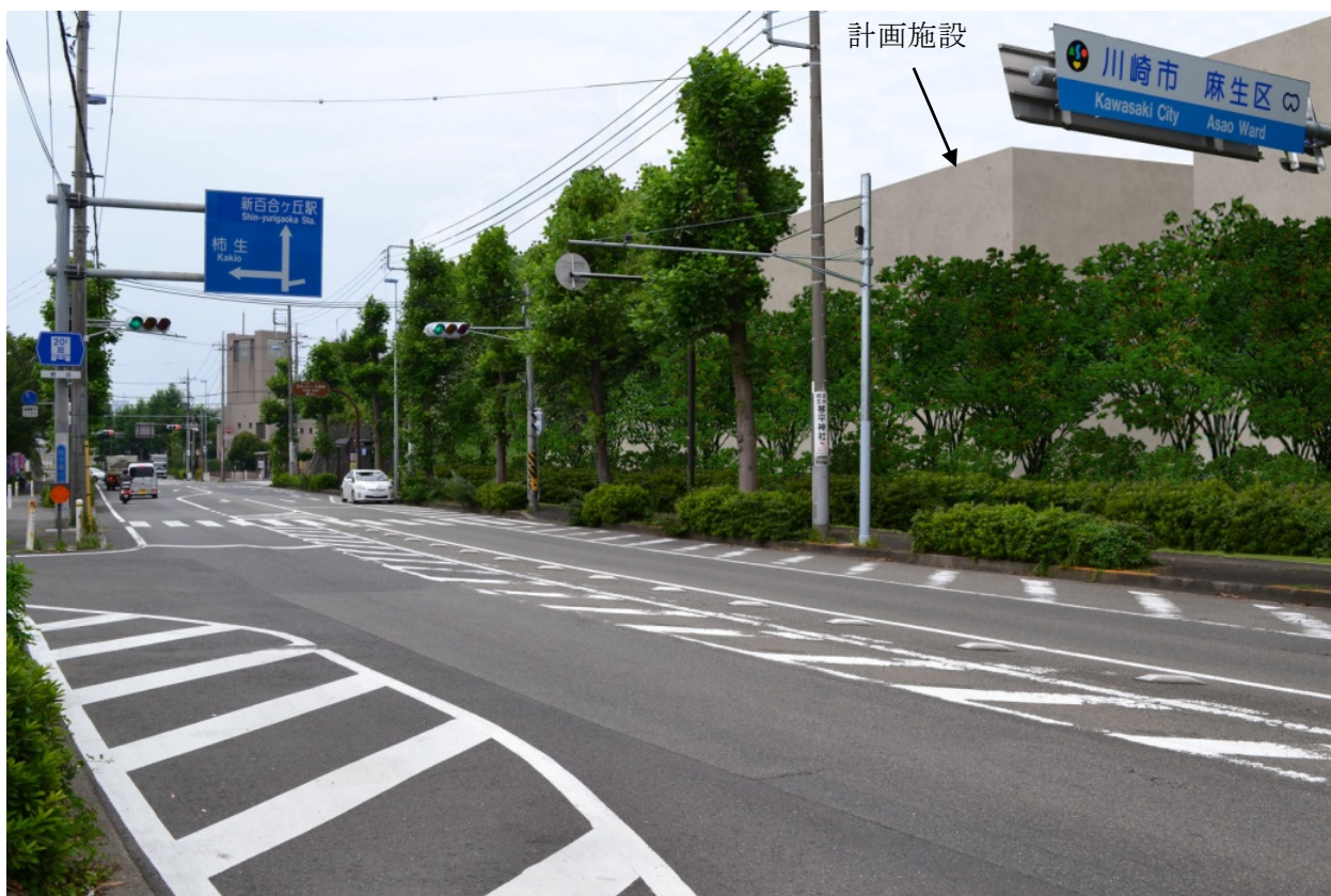
図 8-5-1-2(3) 日常的な視点場からの景観の変化の予測結果