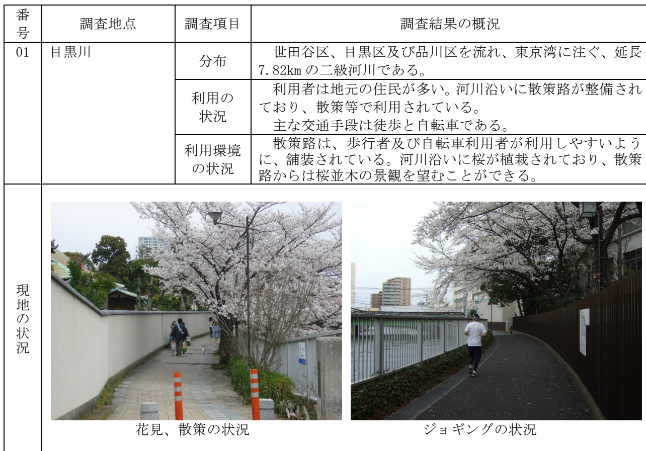
表 8-5-2-2(1) 主要な人と自然との触れ合いの活動の場の分布、利用の状況及び利用環境の状況