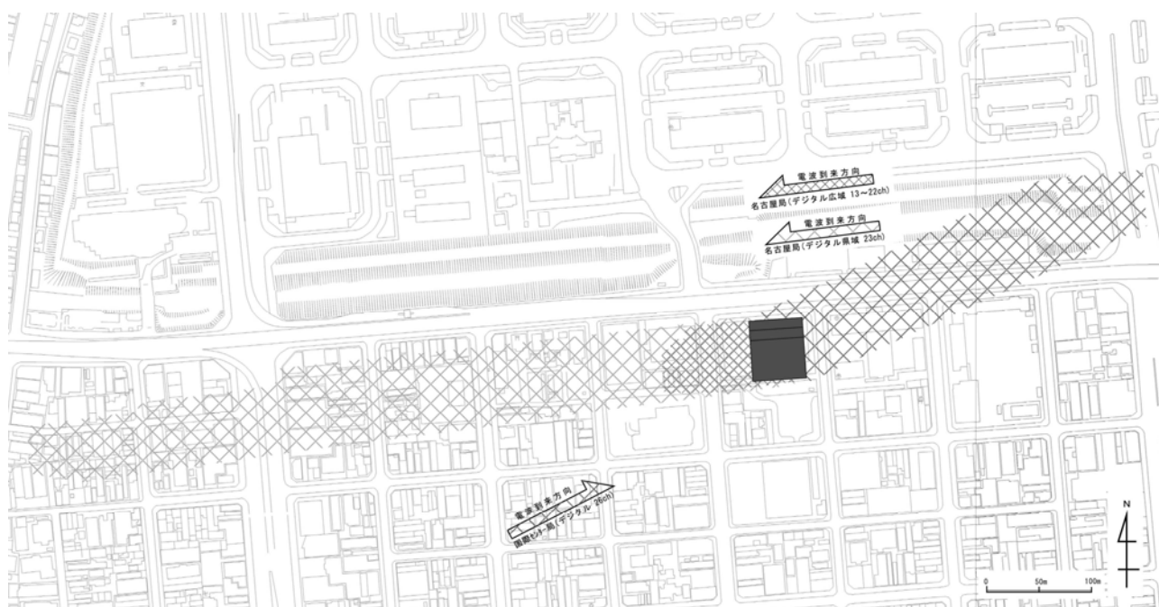
計画配置と予測結果（変電施設）

今後は事前の確認を行うとともに、事業実施後に障害が発生したと判断された場合は、有線テレビジョン放送の活用等の環境保全措置を講じてまいります。